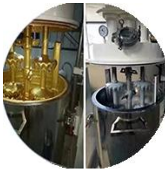
Batching Production Line.