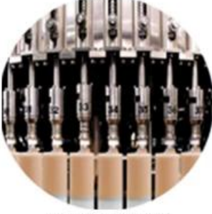
Filling Machine Line