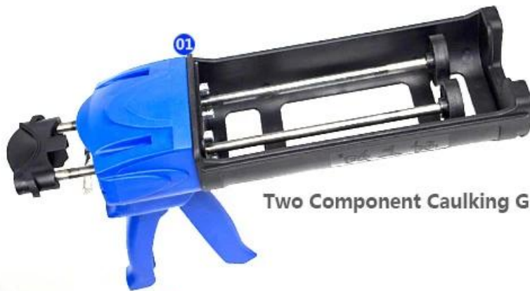
Two Component Caulking Gun