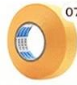
07 Masking Tape