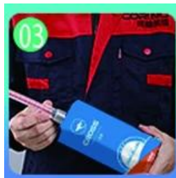
Buka & saksikan, kedua belah pihak dapat diekstrusi.