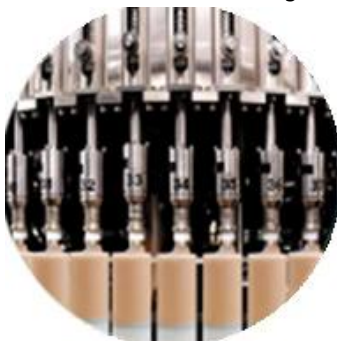
Mengisi garis mesin