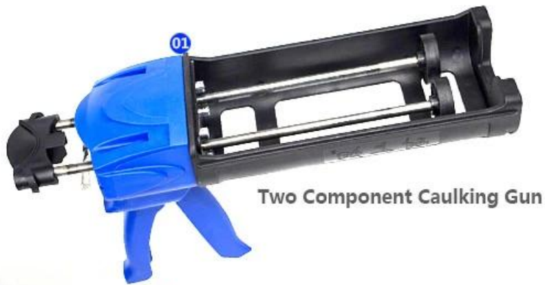
Two Component Caulking Gun