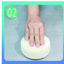
Polandia dengan ubin lilin kecuali ubin mengkilap.