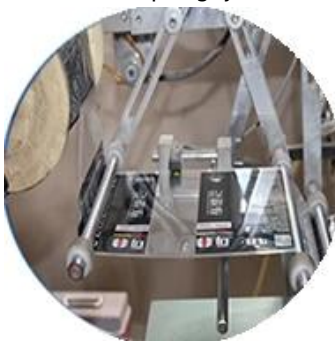
Mesin Dilapisi Film