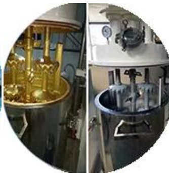
Batching Production Line.