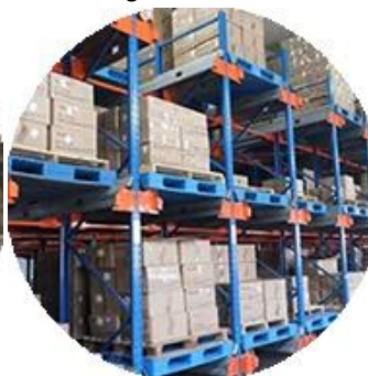
Stok Bahan Nyata