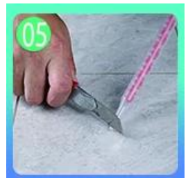
Cenderung memotong bagian atas nozzle dalam 45 °.