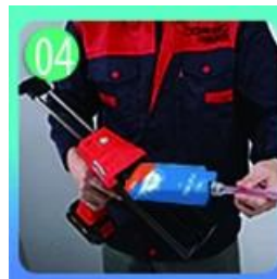
Sekrup pada nozzle, pakai pistol grout.