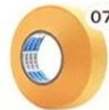
07 Masking Tape