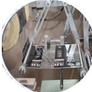
Mesin berlapis film