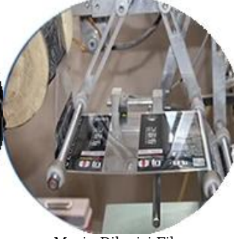
Mesin Dilapisi Film