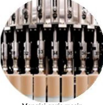
Mengisi garis mesin