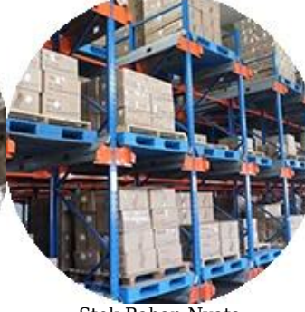
Stok Bahan Nyata