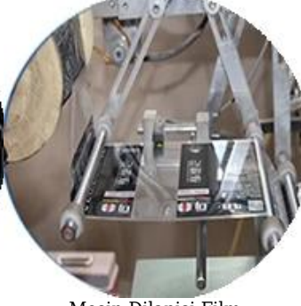
Mesin Dilapisi Film