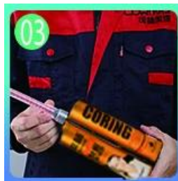
03 Buka & saksikan, kedua belah pihak dapat diekstrusi.