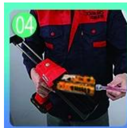
04 Sekrup pada nozzle, pakai pistol grout.