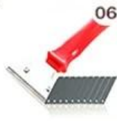
06 Perching Knife