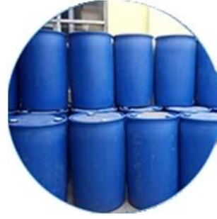
Stok Bahan Nyata