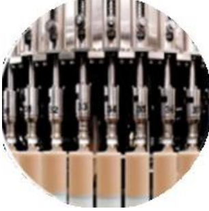
Mengisi garis mesin