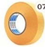
07 Masking Tape