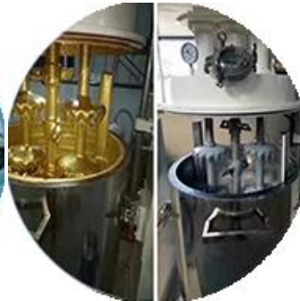
Batching Production Line.