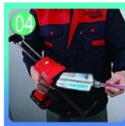
04 Sekrup pada nozzle, pakai pistol grout.