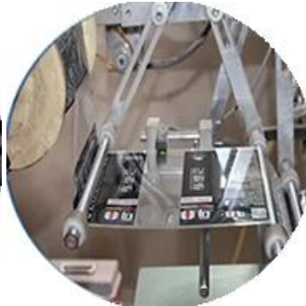
Mesin Dilapisi Film