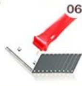
06 Perching Knife