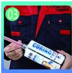
03 Buka & saksikan, kedua belah pihak dapat diekstrusi.