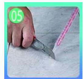
05 Cenderung memotong bagian atas nozzle dalam 45 °.