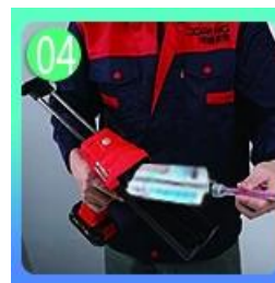
04 Sekrup pada nozzle, pakai pistol grout.