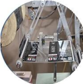
Mesin Dilapisi Film