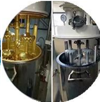
Batching Production Line.