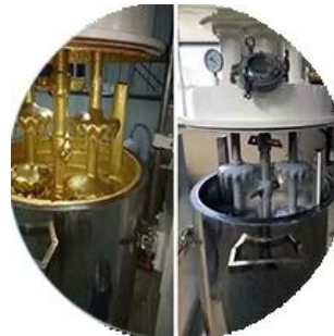
Jalur Produksi Batching