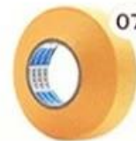
07 Masking Tape