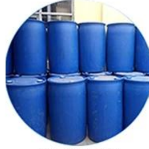
Real Material Stock