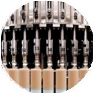
Mengisi garis mesin