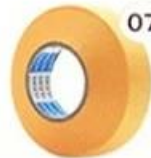
07 Masking Tape