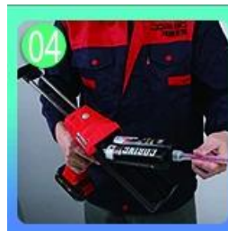
Sekrup pada nozzle, pakai pistol grout.