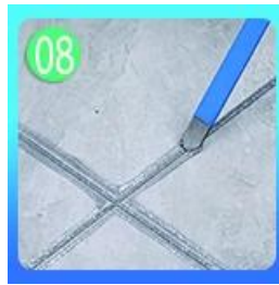
08 Tekan grout dengan alat lem profesional.