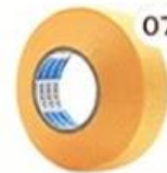
07 Masking Tape