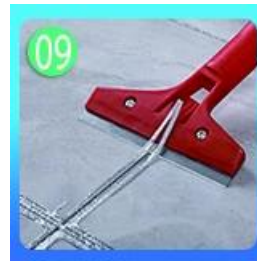
09 Jangan sentuh dalam 4-5 jam dan hapus kelebihan grout.