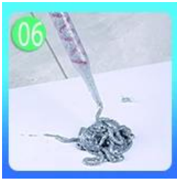
06 Peras nat panjang 60-80cm di forepart.