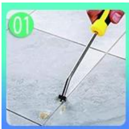
Bersihkan ubin dan tetap kering.