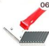
06 Perching Knife