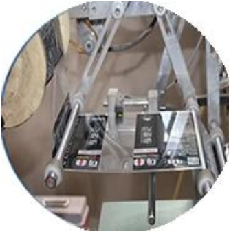
Mesin Dilapisi Film