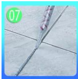
07 Peras dengan merata agen ubin di sepanjang celah.