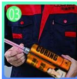
03 Buka & saksikan, kedua belah pihak dapat diekstrusi.