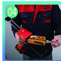
04 Sekrup pada nozzle, pakai pistol grout.