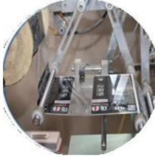
Mesin berlapis film